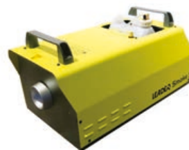
LEADER Smoke 3